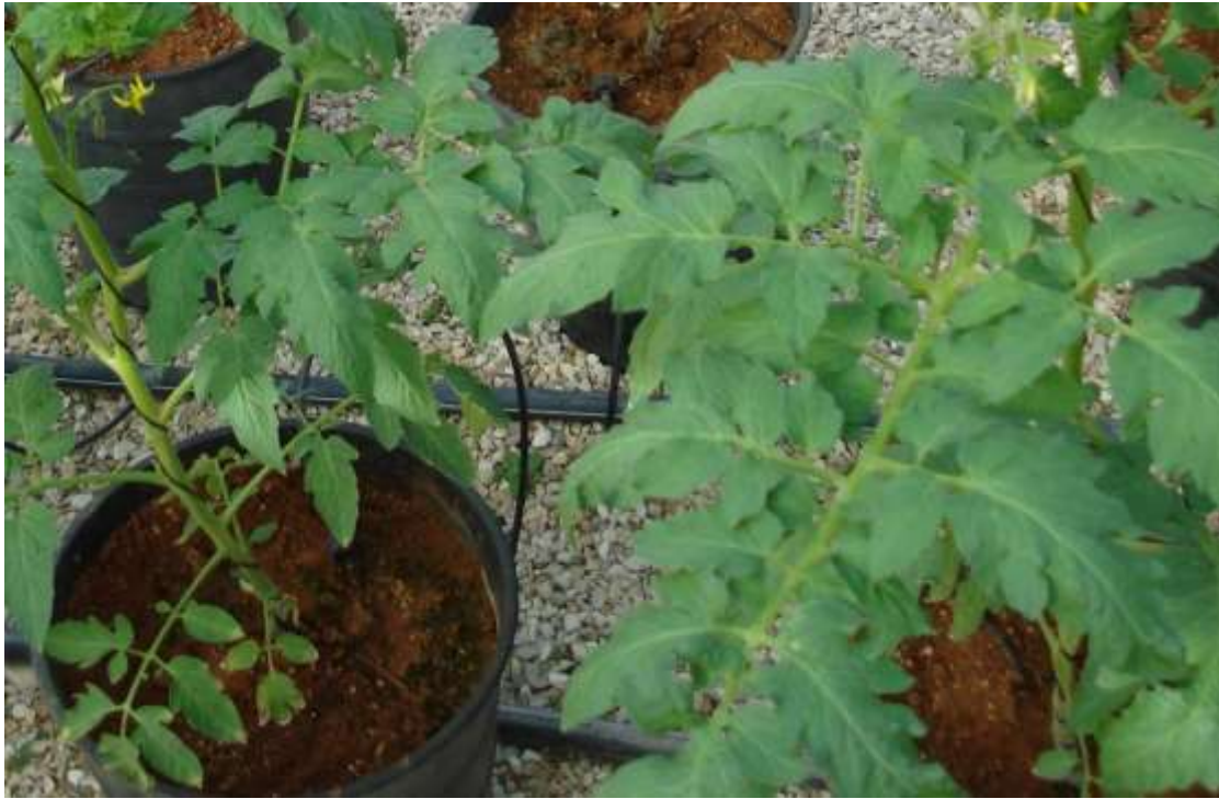
شكل رقم (2) : يوضح لنا الاوراق السليمة لنباتات الطماطة والخالية من الاصابة بالفايروس TYLCV.

وظهرت على نبات الداتورة D. stramonium اعراض تقزم، شفافية العروق، اختزال الورقة و تشوهها بعد 20 يوما من العدوى. وعلى عناب الذيب S. nigrum ظهرت اعراض شفافية العروق خصوصا عل الاوراق الحديثة، و نشوة الاوراق السفلية بعد 20 يوما من العدوى. و يلاحظ في الجدول ان عوائل اخرى لم تظهر عليها اعراض اصابة الا ان الفحص المصلي بتقنية ELISA أثبت احتواءها على الفايروس و هي : الزربيج Ch. amaranticolor ، الفاصوليا Ph. vulgaris ، التبغ البري N. glutinosa و قد تعمل هذه العوائل و التي ينمو بعضها طبيعيا في البيوت البلاستيكية و حولها، دورا مهما في وبائية الفايروس بوجود حشرة الذبابة البيضاء. و قد اشارت دراسات عدة الى نتائج مماثلة حول المدى العائلي للفايروس و الاعراض التي يسببها على هذه العوائل (Abdel-Salam ، 1990 ، Brunt ، 1990 و آخرون Jorda ، 1997 و آخرون، 2000 Aveglis و آخرون، 2001 ، Salti و آخرون، 2002 ، Czosnek و Laterrot ، 1997 ، Navas-Mariones و Castillo، 2000).